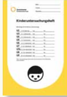
U-defteri (U-Heft) bu şekilde görünür

Muayeneler çok önemlidir. Bu nedenle bütün bu muayeneleri dikkate alın ve her zaman çocuğunuzun muayene defterini (U-defteri = U-Heft) ve aşı karnenizi yanınızda getirin. “U” muayeneleri çocuğunuzun sağlığı için önemlidir.