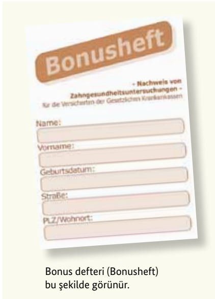
Bonus defteri (Bonusheft) bu şekilde görünür.

Sağlıklı dişler yaşam kalitesinin bir parçasıdır. Bu nedenle düzenli yapılan koruyucu muayeneler, şikâyetiniz olmasa da önemlidir. Yasal sağlık sigortaları bu koruyucu önlemlerin masraflarını da karşılamaktadır. Bu muayeneler belli hastalıkların erken teşhisi ve tedavisinde yardımcı olurlar. Sigorta kurumunuzdan bu uygulama için “bonus defteri” (Bonusheft) olarak adlandırılan bir defter alabilirsiniz. Bu deftere koruyucu muayeneler yazılır. Diş hekimine yılda en az bir kez (18 yaşın altında en az altı ayda bir) gittiğinizi belgeleyebilirsiniz, sigorta kurumunuz, diş protezi gerekli olduğunda daha fazla bir ödeme yapmaktadır.