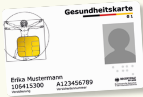
Örnek bir sağlık kartı (Gesundheitskarte)

Sağlık hizmetlerinden faydalanmak istediğinizde lütfen elektronik sağlık kartınızı (elektronische Gesundheitskarte) her zaman yanınızda bulundurun. 1 Ocak 2015'ten bu yana, sadece bu kart ile yasal sağlık sigortası hizmetlerinden faydalanabilme hakkınız bulunmaktadır. Elektronik sağlık kartında isminiz, doğum tarihiniz ve adresiniz ayrıca sağlık sigorta numaranız ve sigortalılık durumunuz (üye, aile bireyi olarak sigortalılık ya da emeklilik) gibi zorunlu bilgiler bulunmaktadır. Elektronik sağlık kartında ayrıca vesikalık fotoğrafınız yer alır.